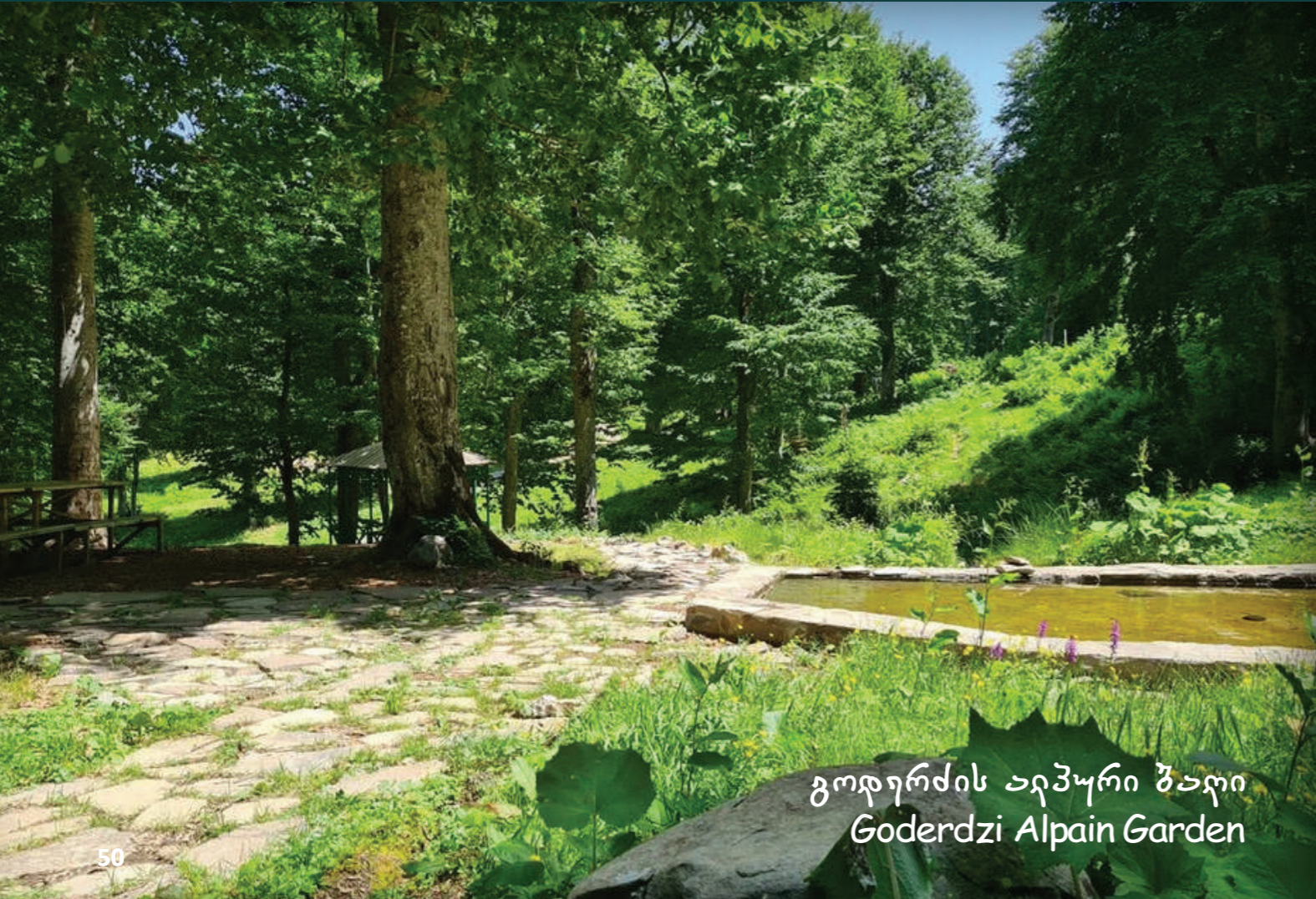
გოდერძის ალპური ბაღი Goderdzi Alpin Garden

ჰესის მშენებლობის პერიოდში რეგიონში საგრძნობლად გაიზარდა ეკონომიკური აქტივობა. შეიქმნა ახალი სამუშაო ადგილები, გაიზარდა მოთხოვნა მომსახურების სფეროში და გააქტიურდა ადგილობრივი მცირე ბიზნესები. ეს განსაკუთრებით მნიშვნელოვანი იყო იმ მუნიციპალიტეტებისთვის, სადაც დასაქმების შესაძლებლობები ტრადიციულად შეზღუდულია.