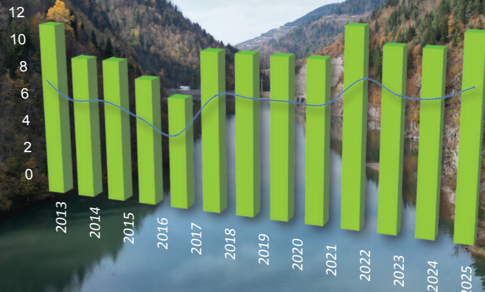
TOTAL NUMBER OF CATCHED SPECIES IN ALL STATIONS ყველა სადგურში დაჭარილი სახეობების საერთო რაოდენობა